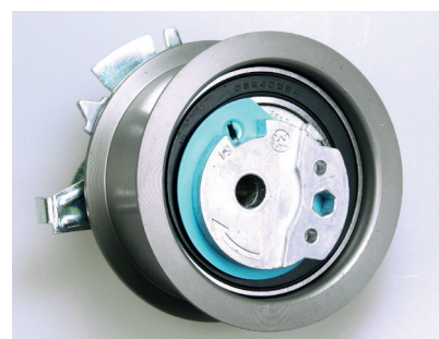
Рис. 1 Старая конструкция ролика

Для установки правильного натяжения, ролик новой конструкции сначала должен быть сжат как можно сильнее с использованием новой гайки и шпильки так, чтобы «выступ» на базовой плите натяжителя мог опуститься ниже корпуса (упор максимальной нагрузки): см. Рис. 3.