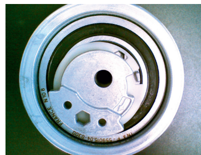
Рис. 2 Новая конструкция ролика